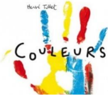
« Couleurs »

Hervé Tullet aime aussi jouer avec les couleurs. Il utilise le plus souvent les couleurs primaires, c'est-à-dire le rouge, le bleu et le jaune qu'il lie avec le blanc et le noir.