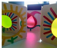
Extrait de « Fleurs ! »