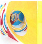
Extrait de « Regarde ! »