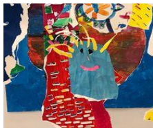
Exposition au King Abdulaziz Center For World Culture