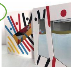
Extrait de « Danse ! »