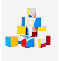
« Blocks »