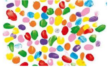
Extrait de « Couleurs »