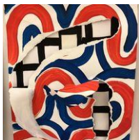
Exposition au King Abdulaziz Center For World Culture