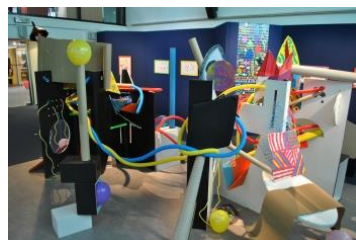
Jeu de sculpture