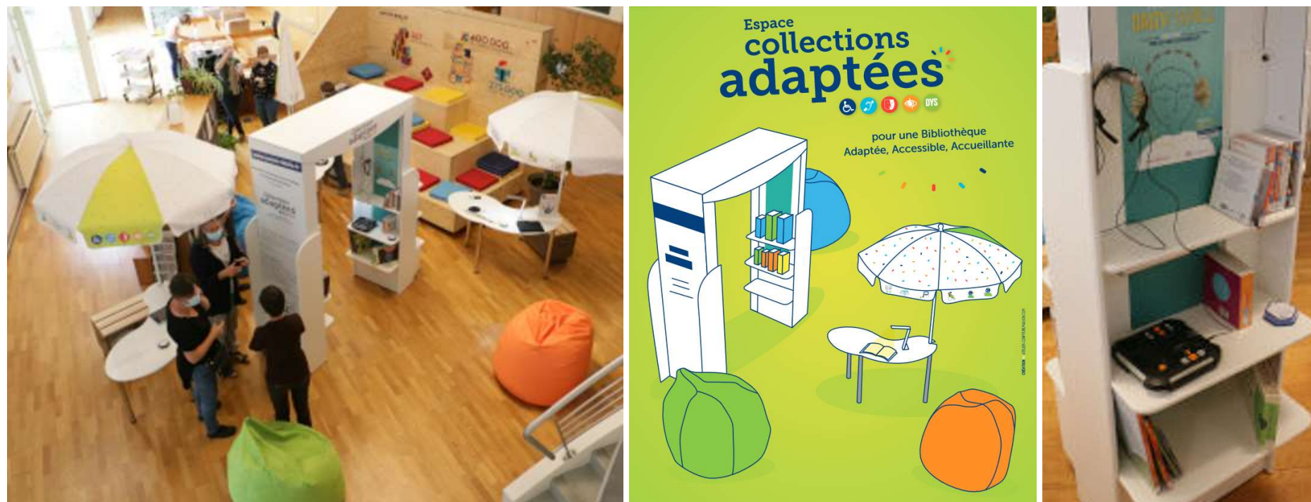
Espace Collections adaptées Savoie